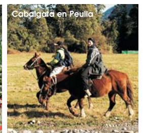
Cabalgata en Peulla