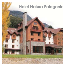
Hotel Natura Patagonia

Muchas gracias por su constante y siempre apoyo el cual nos motiva cada día para seguir trabajando y mejorando nuestro servicio.