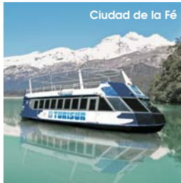
Ciudad de la Fé